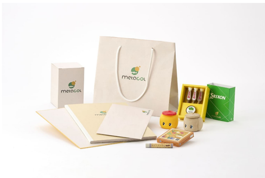
metacol™を使用した製品群

れ、人体に対する安全性も確認されています。現在、CO2回収装置やCO2アップサイクル製品として実用化を進めており、今後はその用途拡大と普及に取り組めます。