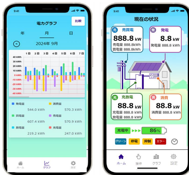
過去の各種電力量 (イメージ図)

直感的なグラフ表示で売買電、充放電、消費、発電などの各種電力量を時系列で確認でき、現在の状況も一目で把握