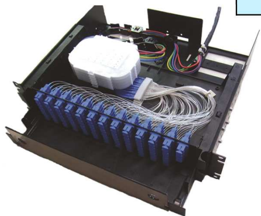
簡易FOプレ配線タイプ