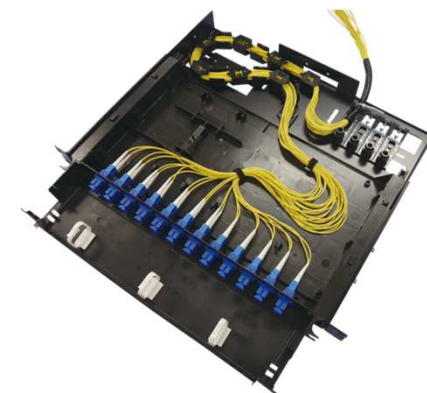
コネクタ接続タイプ