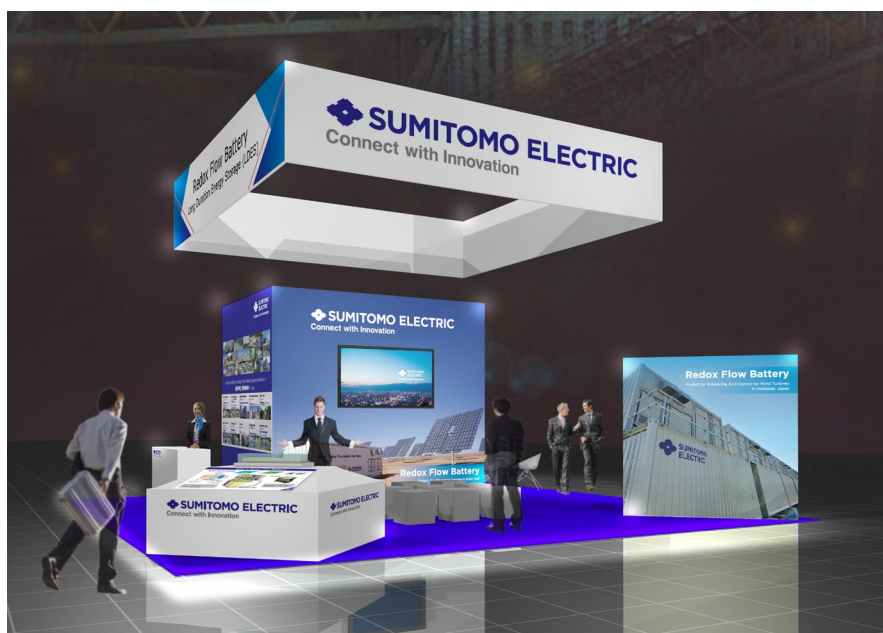
当社ブース（イメージ）

住友電気工業株式会社（本社：大阪府中央区、社長：井上 治、以下 当社）は、2023年2月7日（火）～2月9日（木）に米国・サンディエゴ国際会議場（San Diego Convention Center）で開催される世界最大規模の電力関連技術展「DISTRIBUTECH International 2023」に出展します。