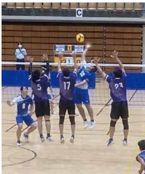
全国大会での健闘

男子バレーボール部は9月開催の「関東9人制バレーボール社会人男女優勝大会」で見事優勝を飾り、10月開催の「全国社会人9人制東ブロック男女優勝大会」ではベスト8の成績をおさめました。これからも、全国優勝を目指し選手一同、更に練習に励んでいきます。