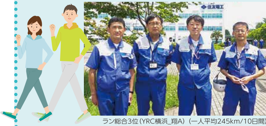
ラン総合3位(YRC横浜_翔A) (一人平均245km/10日間)

コミュニケーション活性化・健康増進等を目的に、全社をつなぐオンライン形式で走行、歩行距離を競うランニング(ラン)・ウォーキングのチーム対抗戦を実施しました。海外の関係会社も含め3,325名(ラン114チーム、ウォーキング444チーム)が参加し各チームごとに記録に挑み、イベントを楽しみました。