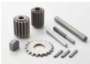
【オーダーメイド超硬素材】