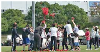
【地域・企業合同匠台運動会】