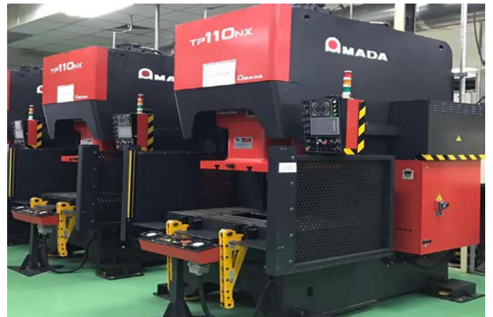
設備の導入及び中古設備の商売