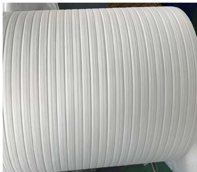
光ファイバー用不織布、吸水テープ等