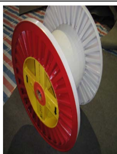
各リール (材質: プラスチック、鉄)